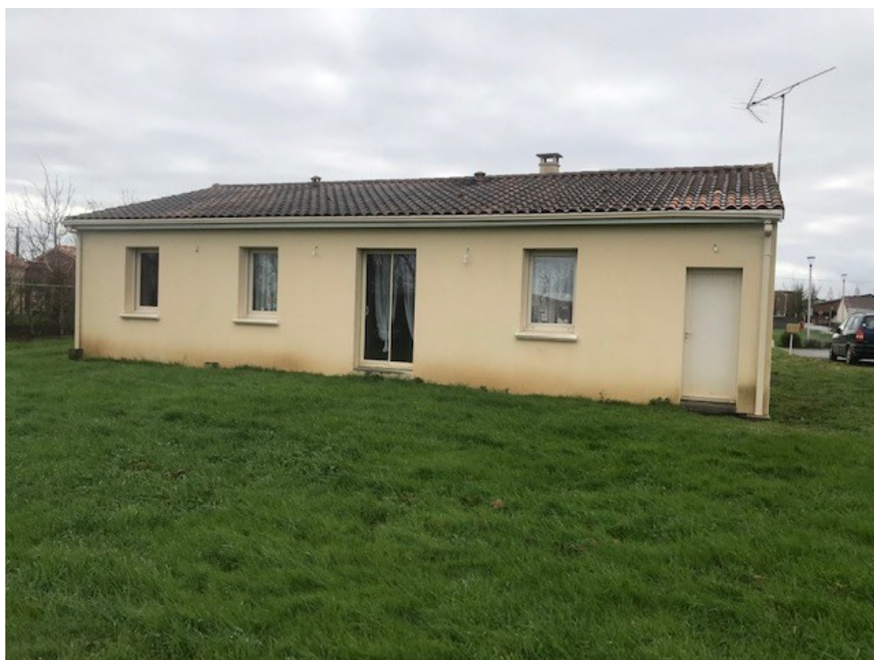
L'arrière de la maison