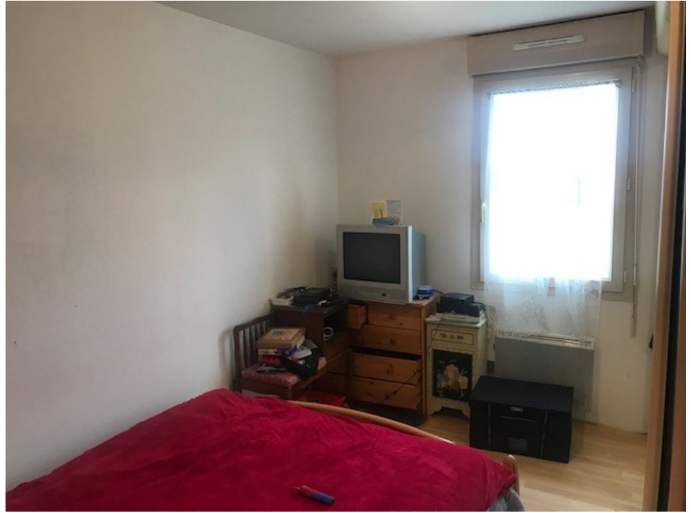
La pièce est en bon état