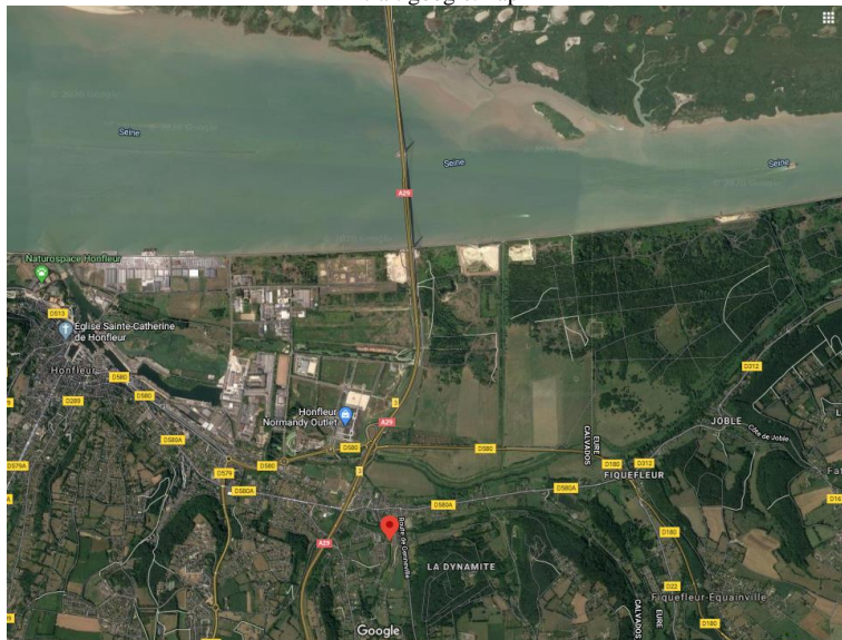
Extrait google map