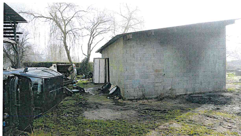
Cette maison est mitoyenne, la toiture est en plaques fibrociment.